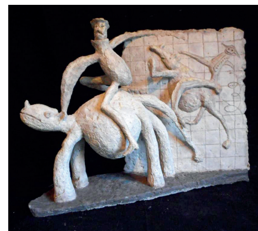
Betongskulptur med inspiration i barnteckningen

"Det tog mig fyra år att måla som Raphael, men en livstid att måla som ett barn"