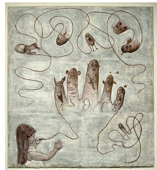
Betongskulptur med inspiration i barnteckningen