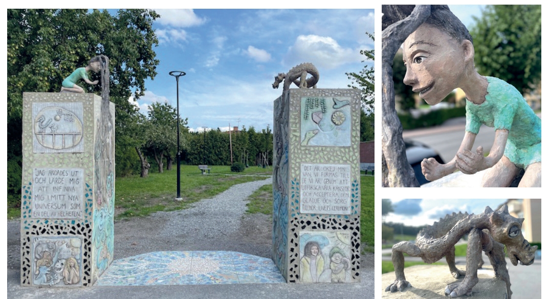
Portal i betongrelief: Sedna, Chipotto och Aton o illustrerar Parvulism och ger Mosaikparken en praktfull och imponerande entré.